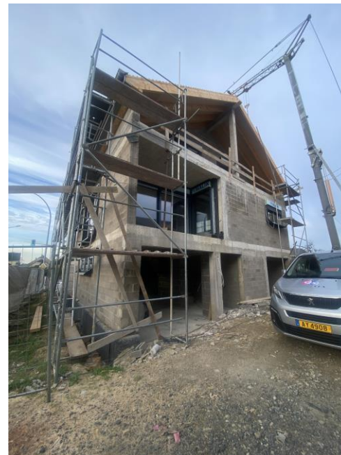
Driemaandelijks update per 31/12/2023